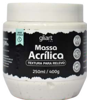
Massa Acrilica Gliart Textura para Relevo