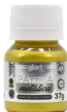
Pátina Metálica Gliart Ouro Rico