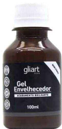
Gel Envelhecedor Gliart Tabaco