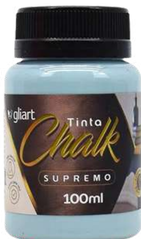
Tinta Chalk Gliart Quartzo Verde