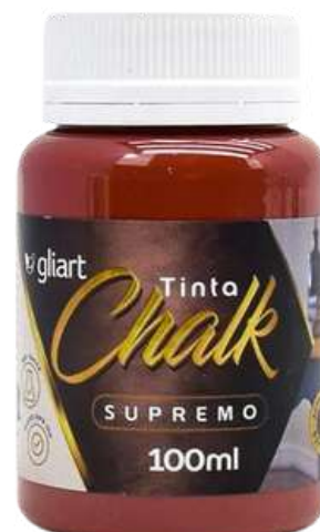
Tinta Chalk Gliart Vermelho Dark