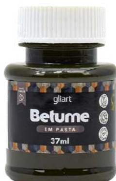
Betume em Pasta Gliart Sépia