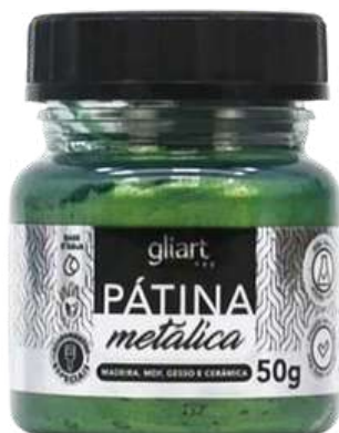
Pátina Metálica Gliart Camaleão