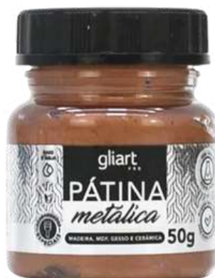
Pátina Metálica Gliart Cobre