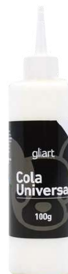
Cola Universal Gliart